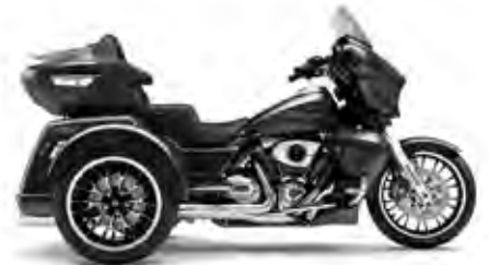
STREET GLIDE® 3 LIMITED LIBERTY EDITION