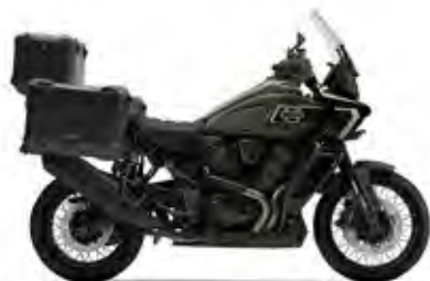
PAN AMERICA® 1250 LIMITED