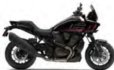
PAN AMERICA® 1250 ST