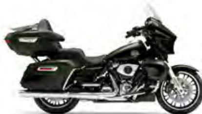
STREET GLIDE® LIMITED