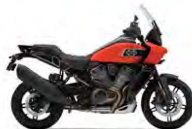
PAN AMERICA® 1250 SPECIAL