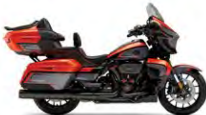
CVO™ STREET GLIDE® LIMITED