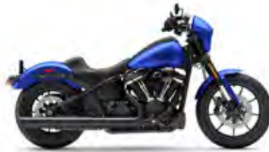
LOW RIDER® S