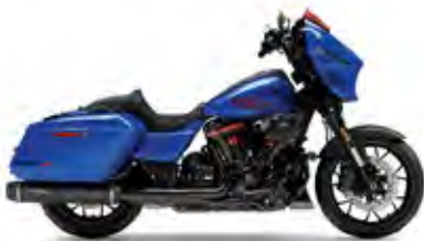
CVO™ STREET GLIDE® ST