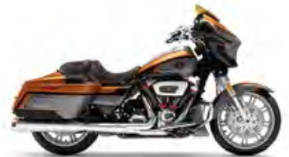
CVO™ STREET GLIDE®