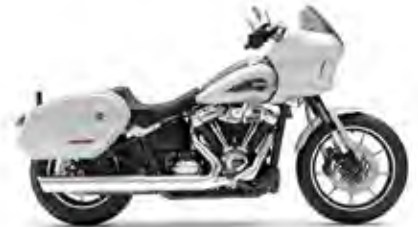
LOW RIDER® ST