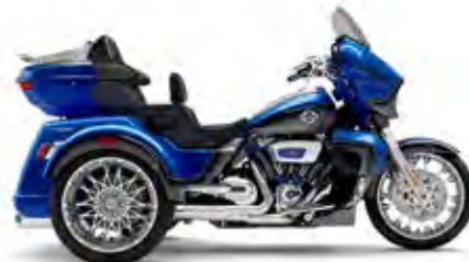
CVO™ STREET GLIDE® 3 LIMITED