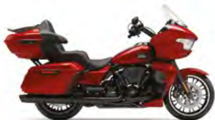
ROAD GLIDE® LIMITED