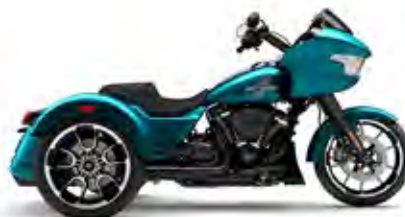
ROAD GLIDE® 3