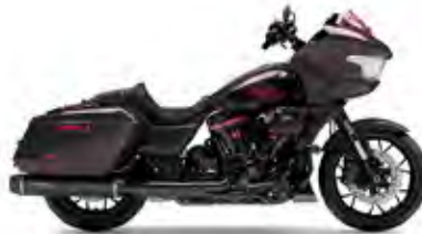
CVO™ ROAD GLIDE® ST