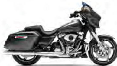
STREET GLIDE® LIBERTY EDITION