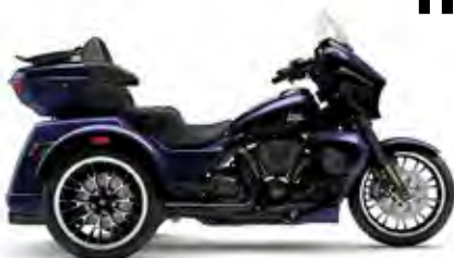
STREET GLIDE® 3 LIMITED