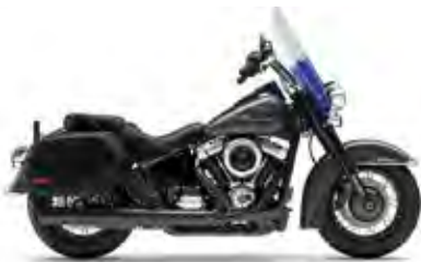
HERITAGE CLASSIC LIBERTY EDITION